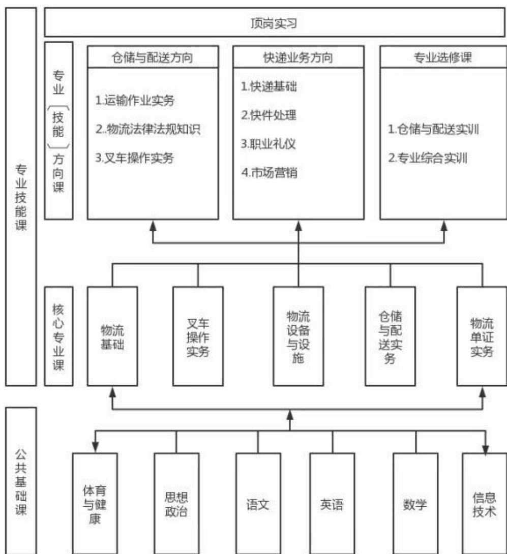
专业课程结构图示

要培养适应企业需要的人才，专业课程设置和教学内容必须与企业的岗位要求相结合。应根据企业职业活动，以工作过程为主线，按照工作任务和职业能力要求来设置课程和教学内容，以职业能力为核心构建整体课程结构体系。这样不仅能避免中、高职课程内容的简单重复，提高教学效果，而且能突出职业教育的特色，有利于造就高素质技术技能型人才。