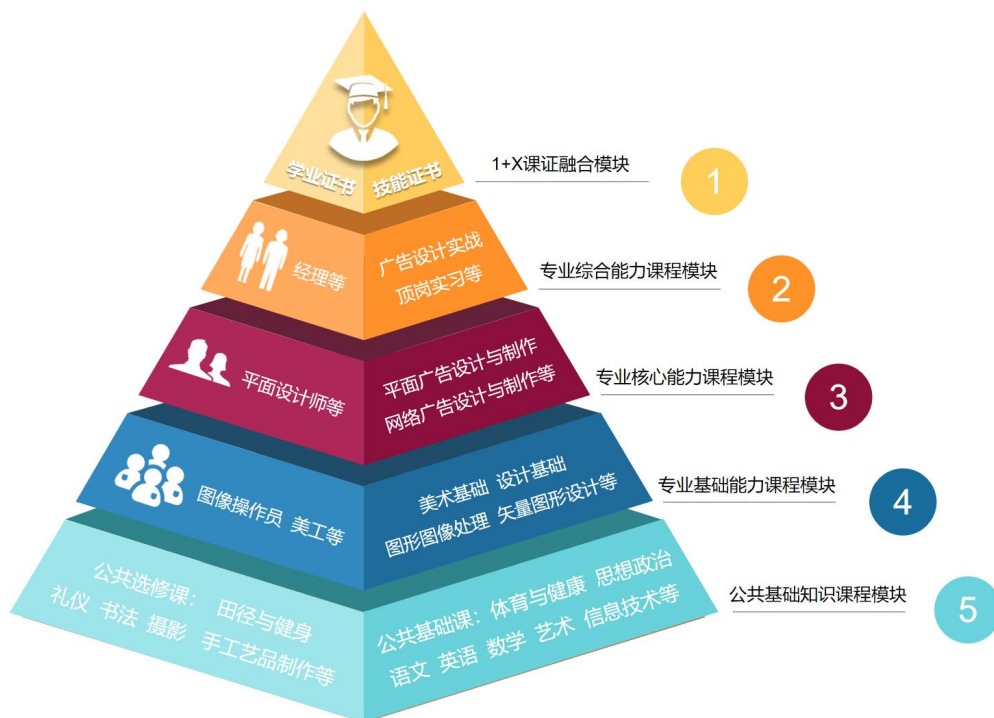
专业课程结构图示

专业课程按照职业基本能力、职业核心能力、职业综合能力的递进顺序形成“能力递进”的专业课程体系。课程体系如图所示：